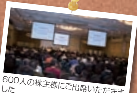
600人の株主様にご出席いただきました