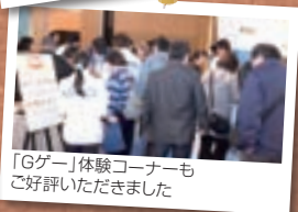
「Gゲー」体験コーナーも ご好評いただきました